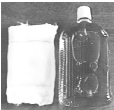
Рис. № 9 Индивидуальный противохимический пакет ИПП-8

ИПП-8 состоит из плоского стеклянного флакона емкостью 125-135 мл, заполненного дегазирующим раствором, и четырех ватно-марлевых тампонов (см. рисунок № 9). Весь пакет находится в целлофановом мешочке.