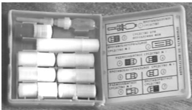
Рис. № 8 Аптечка индивидуальная АИ-2

Аптечка индивидуальная АИ-2 содержит медицинские средства защиты и предназначена для оказания самопомощи и взаимопомощи при ранениях и ожогах (для снятия боли), предупреждения или ослабления поражения радиоактивными, отравляющими или аварийно химически опасными веществами (АХОВ), а также для предупреждения заболевания инфекционными болезнями (См. рисунок № 8).