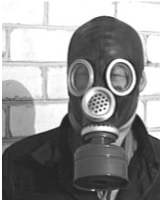
Рис. № 3 Гражданские противогаз ГП-5М

Противогаз ГП-5 состоит из фильтрующе-поглощающей коробки и лицевой части (шлем-маски). У него нет соединительной трубки. Кроме того, в комплект входят сумка для противогаза и незапотевающие пленки или специальный «карандаш».