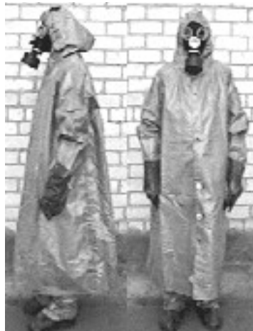
Рис. № 7 Общефойсковой защитный комплект

Фильтрующие средства изготавливают из хлопчатобумажной ткани, пропитанной специальными химическими веществами. Пропитка тонким слоем обволакивает нити ткани, а пространство между ними остается свободным. Вследствие этого воздухопроницаемость материала в основном сохраняется, а пары ядовитых и отравляющих веществ при прохождении через ткань задерживаются. В одних случаях происходит нейтрализация, а в других — сорбция (поглощение). Конструктивно эти средства защиты, как правило, выполнены в виде курток с капюшонами, полукombineзонах и комбинефонах (см. рисунок № 7). В надетом виде обеспечивают значительные зоны перекрытия мест сочленения различных элементов.