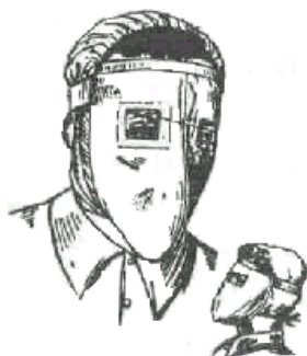
Рис. № 6 Противопыльная тканевая маска ПТМ-1

Ватно-марлевая повязка изготавливается следующим образом. Берут кусок марли длиной 100 см и шириной 50 см; в средней части куска на площади 30 x 20 см, кладут ровный слой ваты толщиной примерно 2 см; свободные от ваты концы марли по всей длине куска с обеих сторон заворачивают, закрывая вату; концы марли (около 30 — 35 см) с обеих сторон посередине разрезают ножницами, образуя две пары завязок; завязки закрепляют стежками ниток (обшивают). Если имеется марля, но нет ваты, можно изготовить марлевую повязку. Для этого вместо ваты на середину куска марли укладывают 5-6 слоев марли.