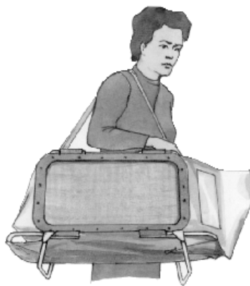
Рис. № 4 Камера защитная детская КЗД-6