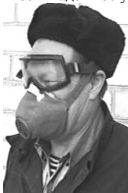
Рис. № 5 Респиратор У-2К

обмерзает, что еще больше снижает эксплуатационные возможности. Для придания полумаске жесткости внутрь вставлены распорки, по наружной кромке укреплена марлевая полоса, обработанная специальным составом. Плотность прилегания обеспечивается с помощью резинового шнура, проходящего по всему периметру респиратора, алюминиевой пластинки обжимающей переносицу, а также за счет электростатического заряда материала ФПП, который обеспечивает мягкое и надежное уплотнение (прилипание) респиратора по линии прилегания к лицу.